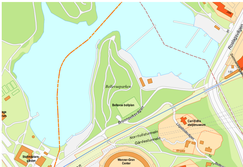
Bellevue bollplan markerad med rött